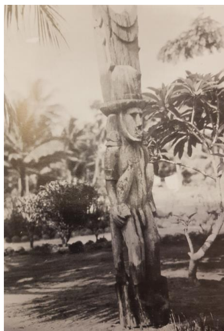
Fig. 5 : Photographie de la statue en 1933