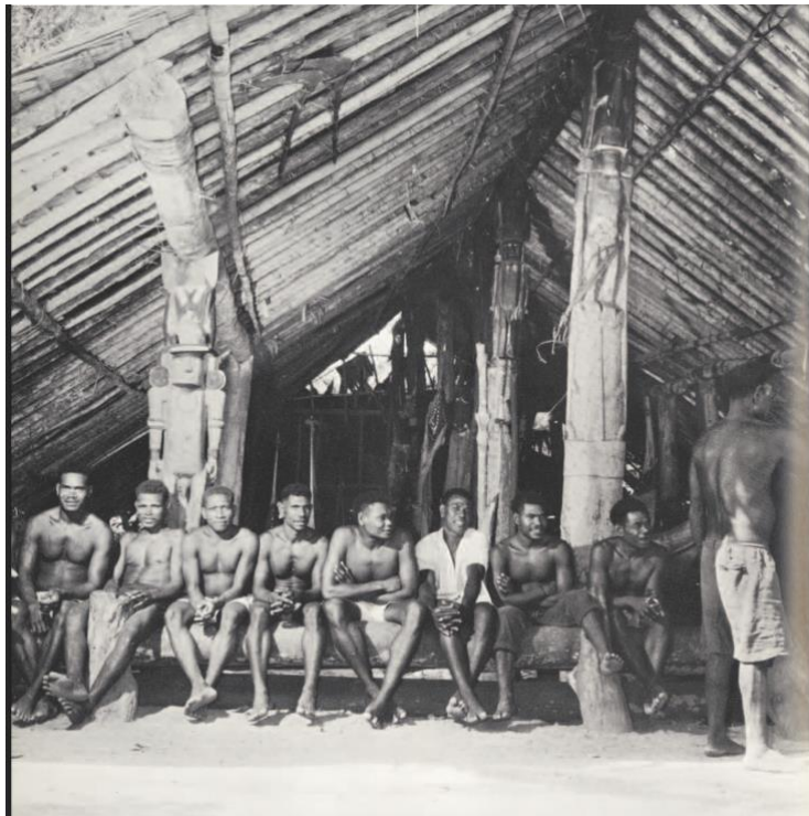
Fig. 7 : Aofa de Natagera © D'après Davenport, « Sculpture », p. 14.