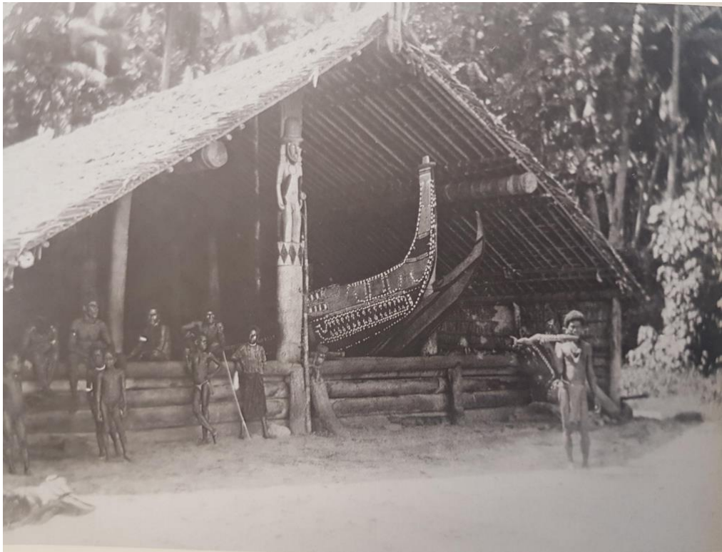
Fig. 3 : Aofa de Gupuna