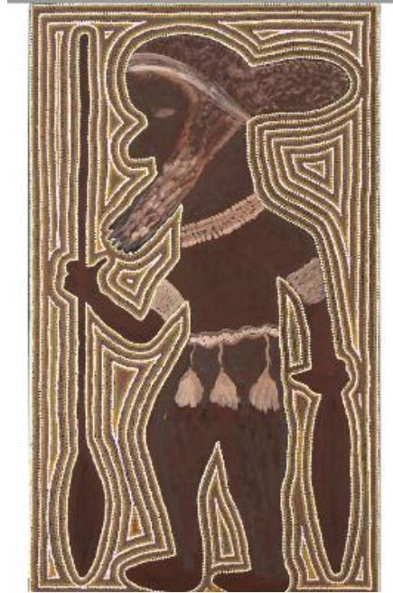
Fig. 1 : Turkey Tolson Tjupurrula (c. 1942-2002), Mon père, le guerrier Mitukatjirri, 1997 Polymère synthétique sur toile de lin