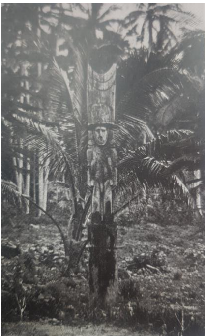
Fig. 4 : Photographie de la statue en 1927-1928