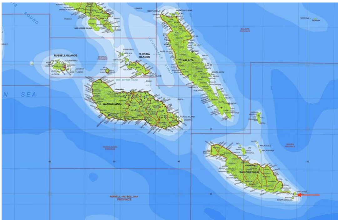
Fig. 2 : Carte des îles Salomon du Sud-Est