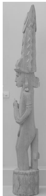
Fig. 10 et 11 : Poteau de faitage, îles Salomon, Santa Ana, Owa Raha © Museum der Kulturen Basel, Vb 7446 ; collection Eugen Paravicini ; photographe : Peter Horner