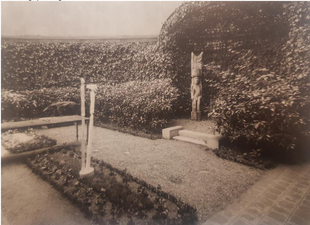
Fig. 6 : Jardin parisien de Charles Ratton © D'après Mélandri, Revolon, « Poteaux de maison », p. 171.