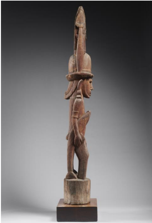
Fig. 8 : Poteau de faitage FGA-ETH-OC-0082