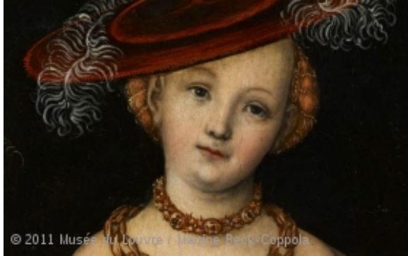
Les Trois Grâces de Lucas Cranach, Détail de la tête du personnage central

Ayant rassemblé les trois quarts de la somme nécessaire à cette acquisition, le musée du Louvre ne disposait que de trois mois pour trouver le million d'euros manquant et a décidé de faire appel à la générosité du public pour compléter la somme. La réponse à cet appel aux dons a dépassé toutes les espérances: en un mois, l'objectif était atteint.