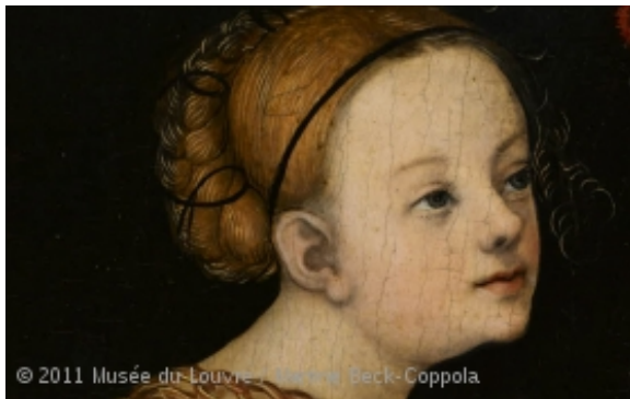
Les Trois Grâces de Lucas Cranach, Détail de la tête du personnage de gauche

En novembre 2010, le Louvre lançait une campagne d'appel aux dons d'une ampleur inédite en vue de l'acquisition d'un chef-d'œuvre de la Renaissance : Les Trois Grâces, de Lucas Cranach l'Ancien. La rareté, la beauté et le parfait état de conservation de cette œuvre justifiaient en effet une action hors norme de la part du musée.