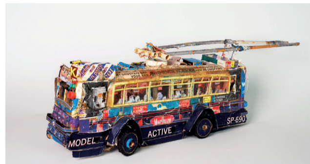
Willem Van Genk, Sans titre , sans date, matériaux divers, 28,5 x 89 x 17,5 cm, Collection de l'Art brut, Lausanne.

➤ VÉHICULES , jusqu'au 27 avril, Collection de l'Art brut, avenue des Bergières 11, Lausanne, Suisse, tél. + 41 21 315 25 70, tlj sauf lundi 11h-18h, www.artbrut.ch